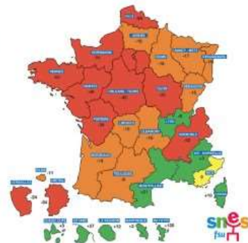
Rentrée 2022 : - 440 emplois dans le 2 nd degré public